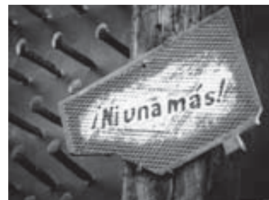
Protestskilt opsat i Juárez med teksten »Ikke en til«.